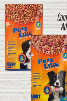
Pets Like Comida para Perros Adultos o Puppies 13.2 Reg. $14.99