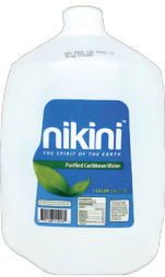
Nikini Agua de Galón 128oz Reg. $1.29