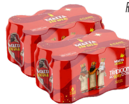
Malta India Regular o Light 6 latas de 8oz Reg. $2.99