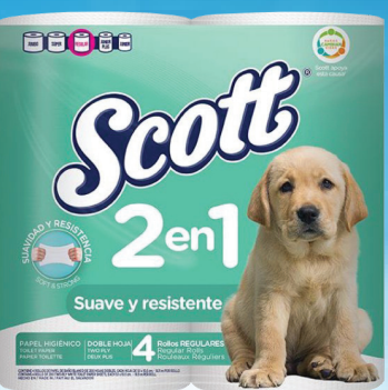
Scott 2 in 1 Papel Sanitario 4/200's Reg. $2.29