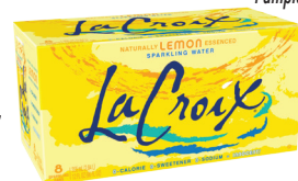
LaCroix Lemon, Lime, Orange, Pampleno o Pure 8/12oz Reg. $6.59