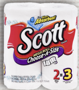
Scott Papel Toalla Mega Roll Choose a Size 2R Reg. $4.59