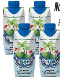
Nutra Coco 11.10oz Reg. $1.79 c/u