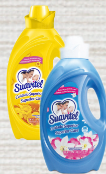
Suavitel Suavizador Variedad 64oz Reg. $4.29 c/u *SVT