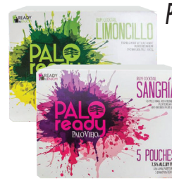
Palo Ready 5/200ml Reg. $5.99