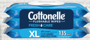
Cottonelle Wipes X Large 135ct 3pk Reg. $9.99