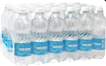
Salutaris Agua 24/16.9oz Reg. $4.99