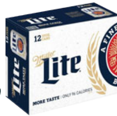
Miller Lite 12 latas de 10oz Reg. $12.99