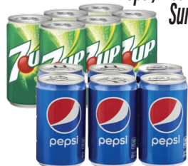
Pepsi, Mountain Dew, Sunkist o 7Up Mini Can 6/7.5oz Reg. $3.99