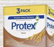
Protex Jabón Variedad 3/3.7oz Reg. $4.29 *SVT