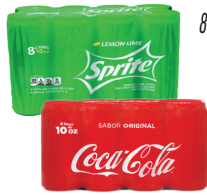
Coca Cola, Sprite o Fanta Variedad 8 latas de 10oz Reg. $4.99 *SVT