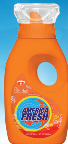
América Fresh Detergente Líquido Original 19.96oz Reg. $1.99