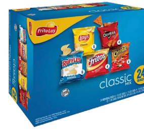
Frito Lay 24 Count Variety Pack Cube 27.5oz Reg. $14.99