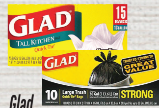
Glad Bolsa para Basura 15/13 o 10/30 Gal Reg. $3.49 c/u