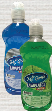
Mi Gente Líquido de Fregar Variedad 12oz Reg. $1.19 *SVT