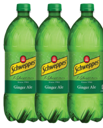
Schweppes Ginger Ale 1.75lt Reg. $1.59 c/u