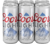
Coors Original o Light 6 latas de 10oz Reg. $6.99