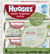
Huggies Baby Wipes Natural Care, Refresh Clean o Simply Clean 3pk 168 a 192ct Reg. $9.69