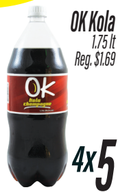
OK Kola 1.75 lt Reg. $1.69